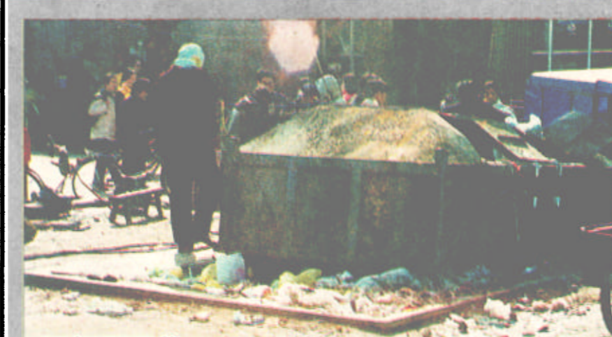
大风无情 有情 四警士救助摔昏行人