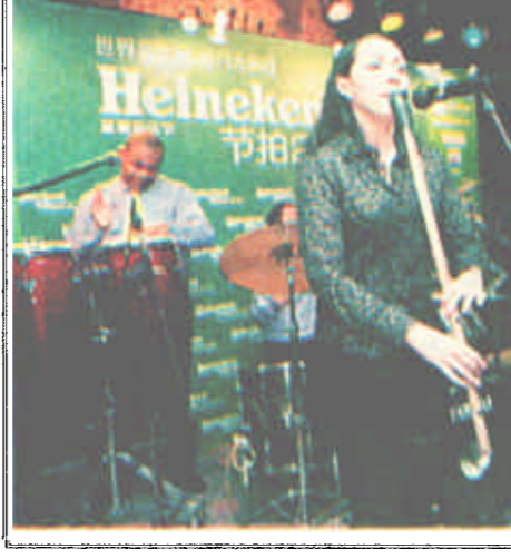
琼瑶首次和中央电视台携手合作。